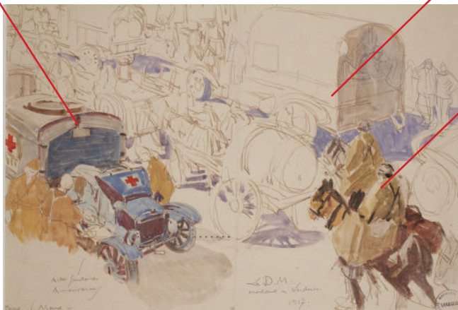
Mathurin Méheut, «La D.M. montant à Verdun», © ADAGP, Paris 2024.

Qu'est ce qui est représenté au premier plan ? Décris brièvement ce qui se passe.