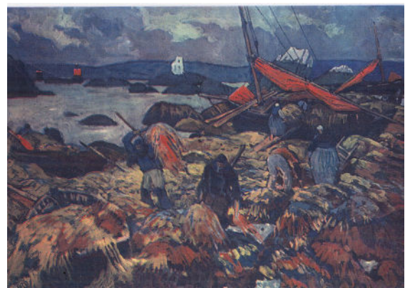
Mathurin Méheut, Goémoniers, hiver en baie de Morlaix , © ADAGP, Paris 2025.