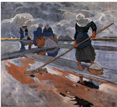
Mathurin Méheut, Les ramasseuses de sel à Guérande , © ADAGP, Paris 2025.

La pêche n'est pas la seule activité près de la mer. D'autres métiers existent. Observe les deux oeuvres ci-dessous et réponds aux questions.