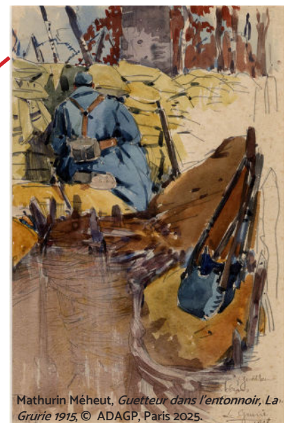
Mathurin Méheut, Guetteur dans l'entonnoir, La Grurie 1915